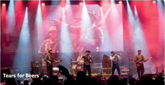
Tears for Beers